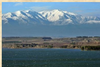
Entre Mer & Montagne