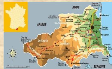
A 10 minutes de l'Espagne